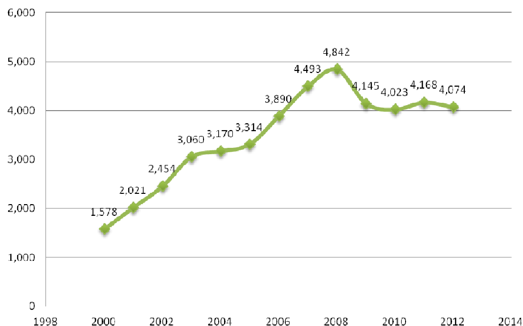
GRÁFICO 3. REMESAS EN COLOMBIA (MILLONES DE USD)