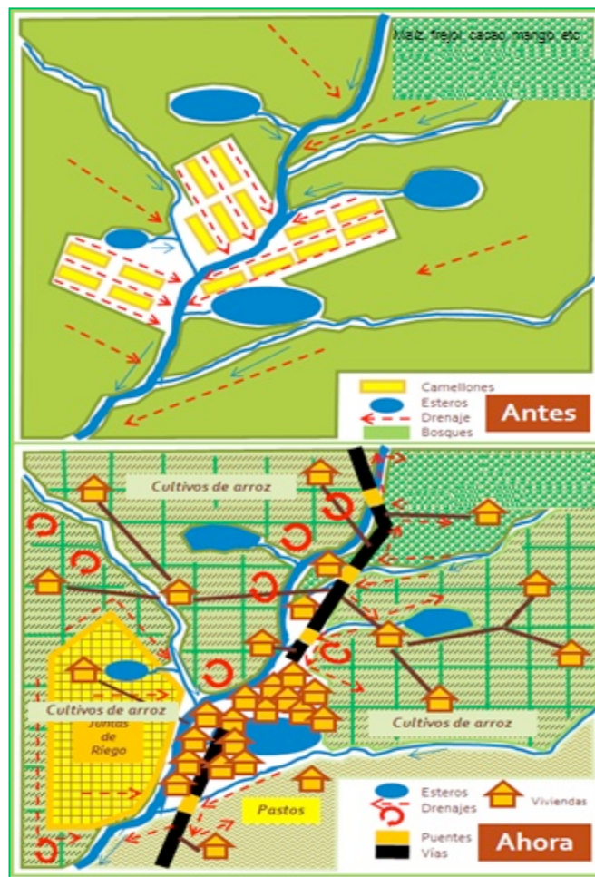
Gráfico 3: Transformación del territorio