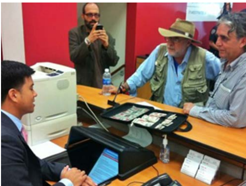
Bloody Money.

Trastocar de cierta manera este orden invoca también a la institución oficial. La vigilancia policiaca fue sorprendida por la acción del Bloody Money, y entró en acción al interior del banco. Llamó a los medios que acompañaban a las víctimas a desalojar. Soltó dos advertencias antes de un posible arresto. Presentó las credenciales de la coerción estatal que respaldan las transacciones financieras.