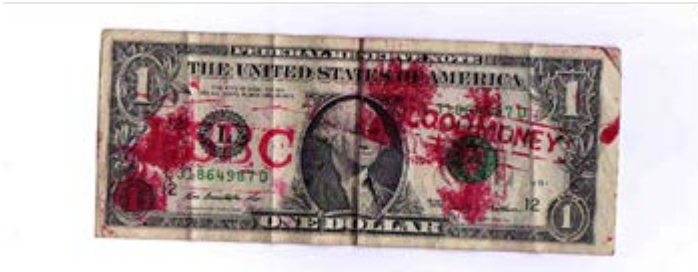
Bloody Money. Comisión de Arte y Cultura, MPJD

La acción no carece de registro. Se habló con medios que acompañaban a la Caravana para introducirse con las víctimas y registrar la interpelación a la que se llamó Bloody Money. Incluso, varios medios nacionales en México registraron la acción del poeta en el banco. Pocos sabían realmente que fue una acción discutida y pensada por el grupo de arte en las orillas del Lago Míchigan en Chicago, un par de días antes de la llegada de la Caravana a NY.