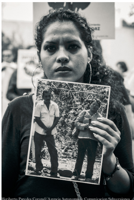
Heriberto Paredes Coronel/Agencia Autónoma de Comunicación Subversiones