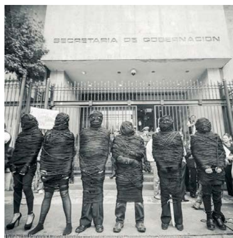
Cuenda Interpelación.

La colaboración de los integrantes del Movimiento generó ciertas acciones y expresiones simbólicas de la relación ausencia y presencia con los materiales de las madejas, desarrollando un lenguaje compartido que tuvo lugar en el taller y, finalmente, encontró salidas al espacio público para la visibilización de la tragedia. Lo que nos hace recordar que algunas de las claves que han acompañado a este movimiento se refieren no sólo a la lucha por la anulación material de la violencia, sino también a la lucha por la anulación en la dimensión simbólica. Es parte del proceso de recuperar la presencia simbólica y material en la vida activa. Los asesinados, los desaparecidos, los desplazados y los asesinatos de mujeres se constituyen atmósferas simbólicas de biografías de la ausencia que se acompañan y requieren de la operación simbólica de la recuperación de la presencia para la narrativa del actor político, por ello la relevancia de los activistas culturales en la producción cultural, los circuitos, los mensajes y su recepción y su colaboración directa con los familiares.