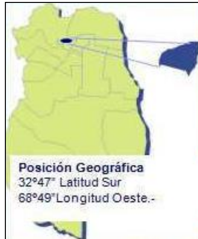
Fig. N° 1 Posición Geográfica del Departamento de Guaymallén