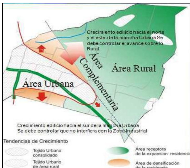
Fig. N°4. Expansión Urbana Guaymallén, Mendoza.