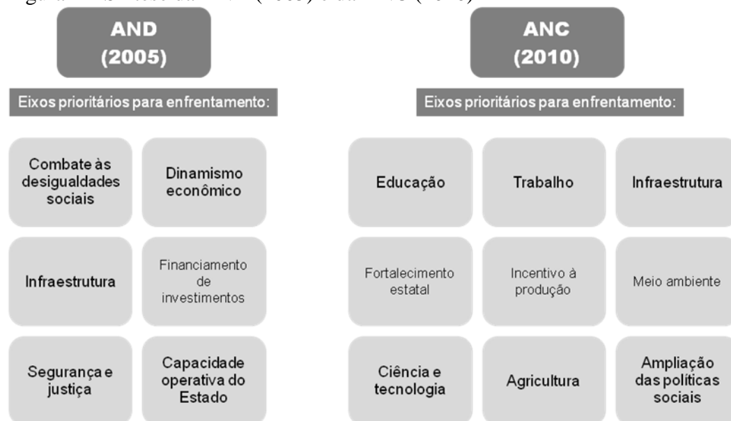
Figura 2 – Síntese da AND (2005) e da ANC (2010)

Nacional para um Novo Ciclo de Desenvolvimento. Os principais eixos das duas Agendas podem ser visualizados na figura abaixo.