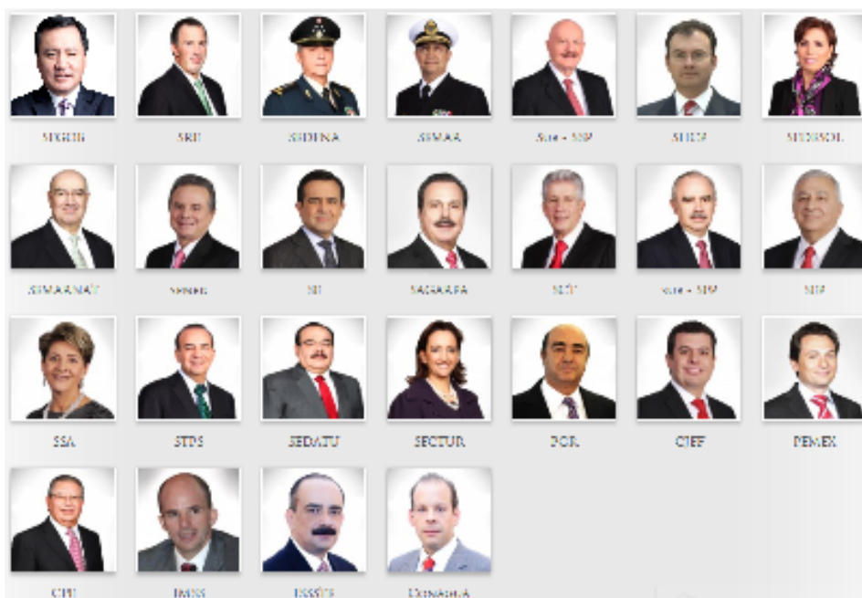
Figura 2. Gabinete del Gobierno Federal, México, 2013.